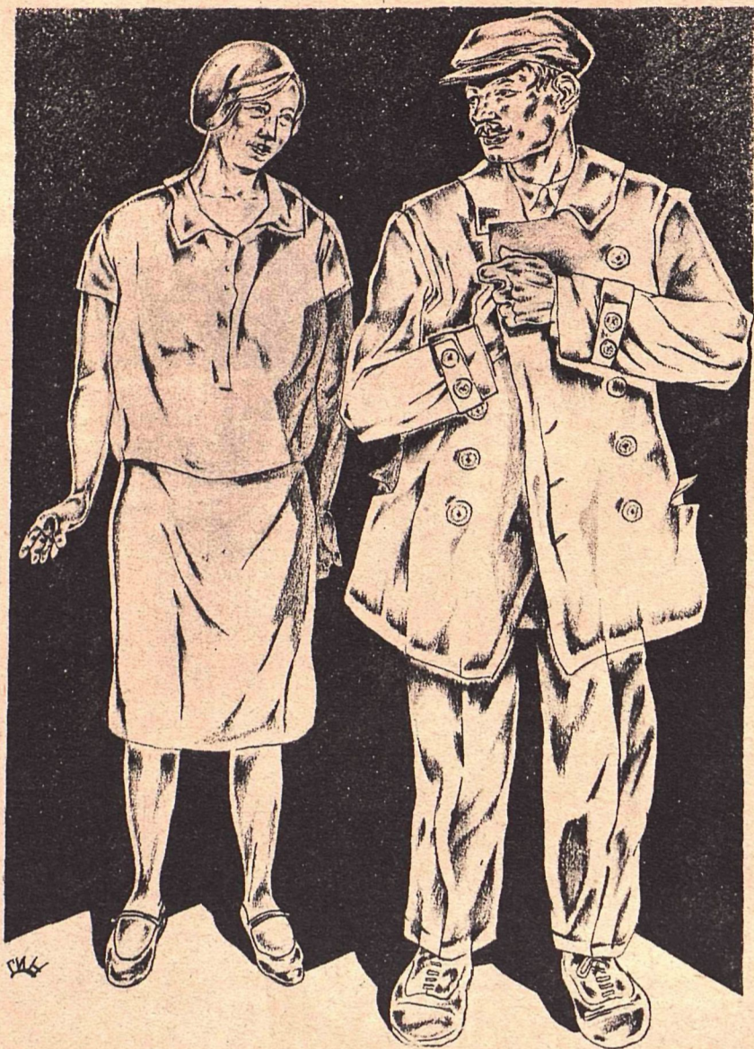
Рис. В. Гин