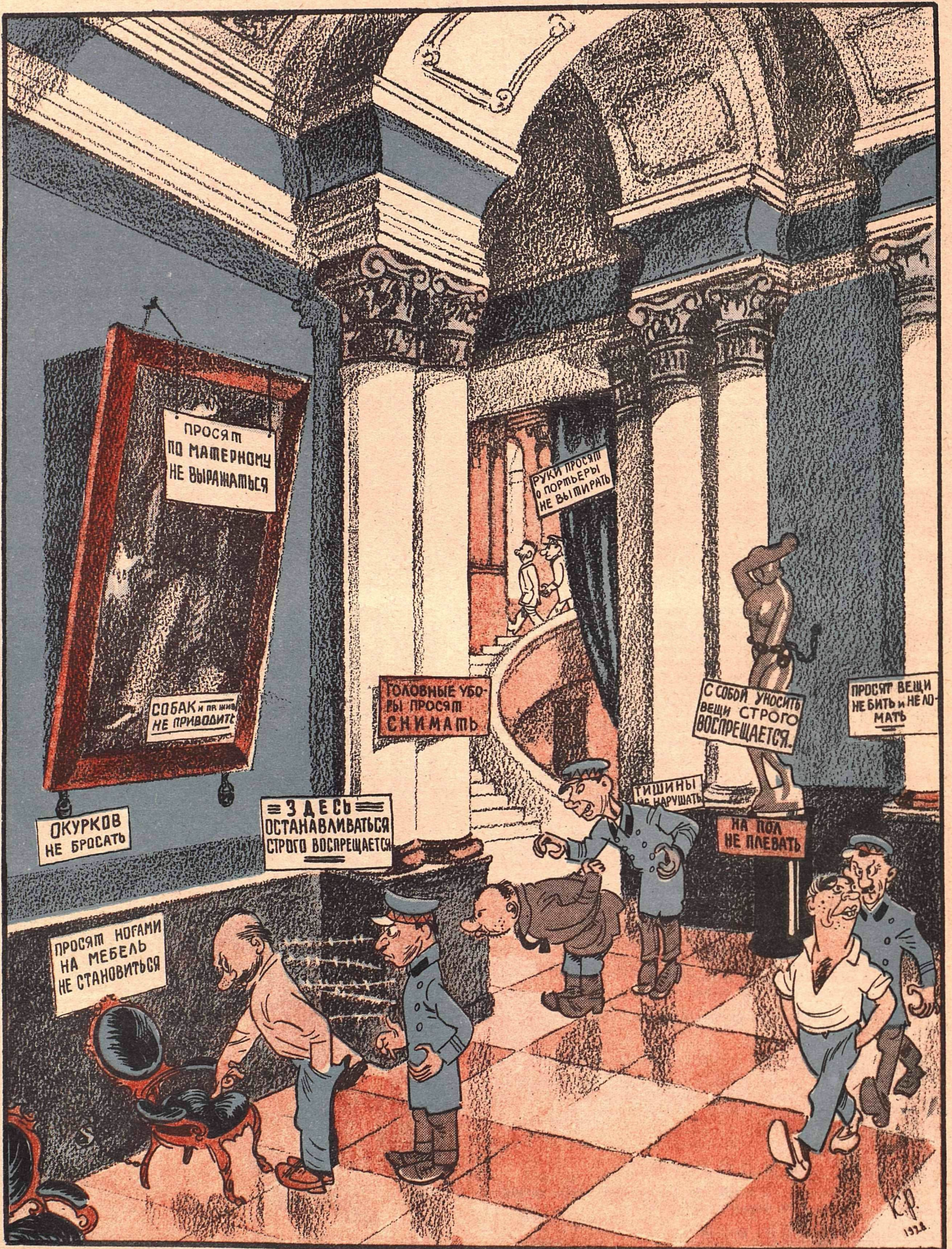
ОХРАНА ДВОРЦОВ КУЛЬТУРЫ ПО ПРОЕКТУ „КРОКОДИЛА“.