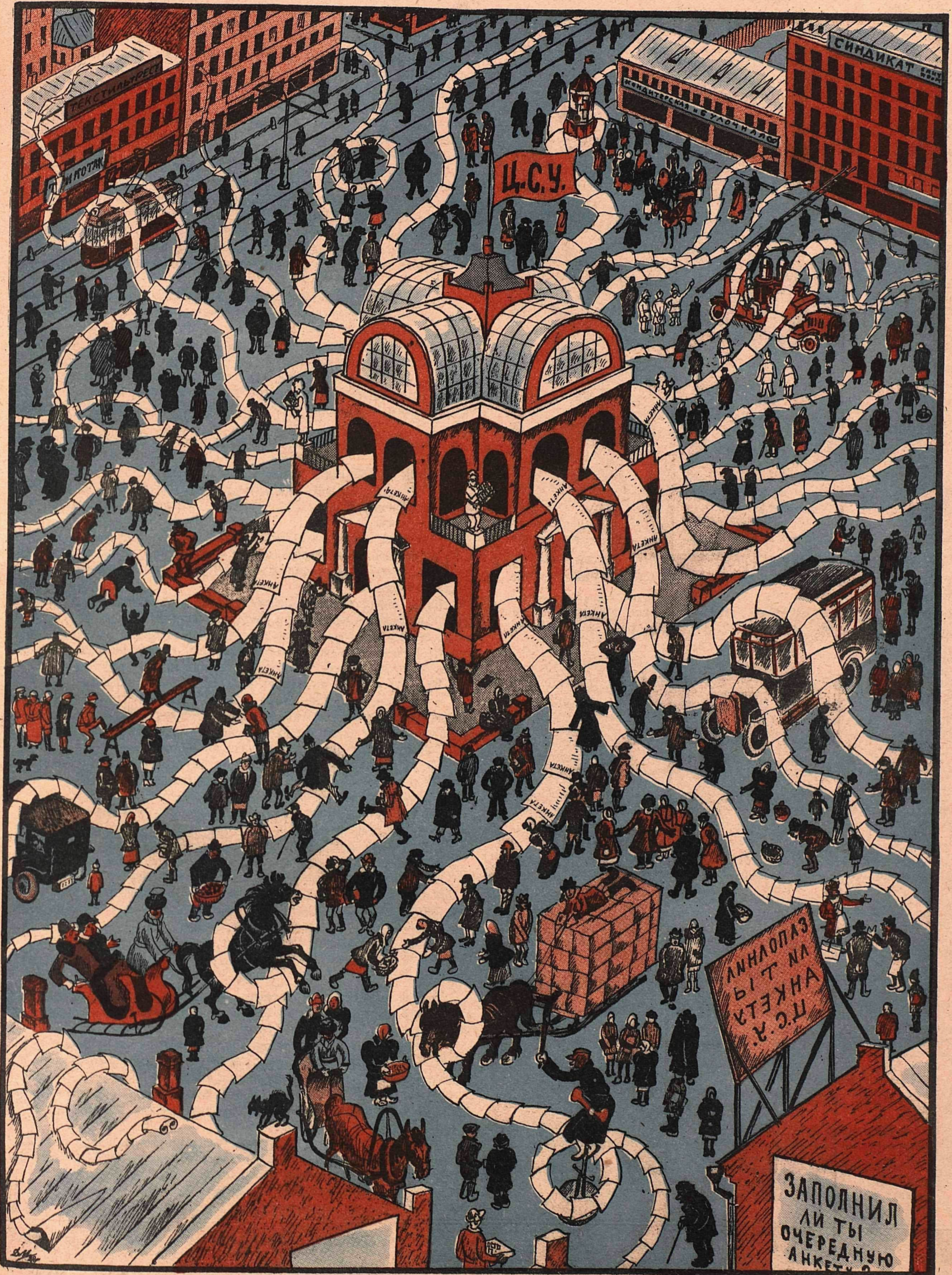
Рис. Д. Мельникова