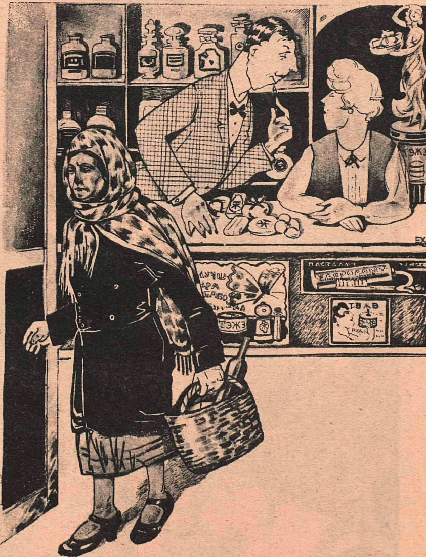
Рис. К. Хомзе