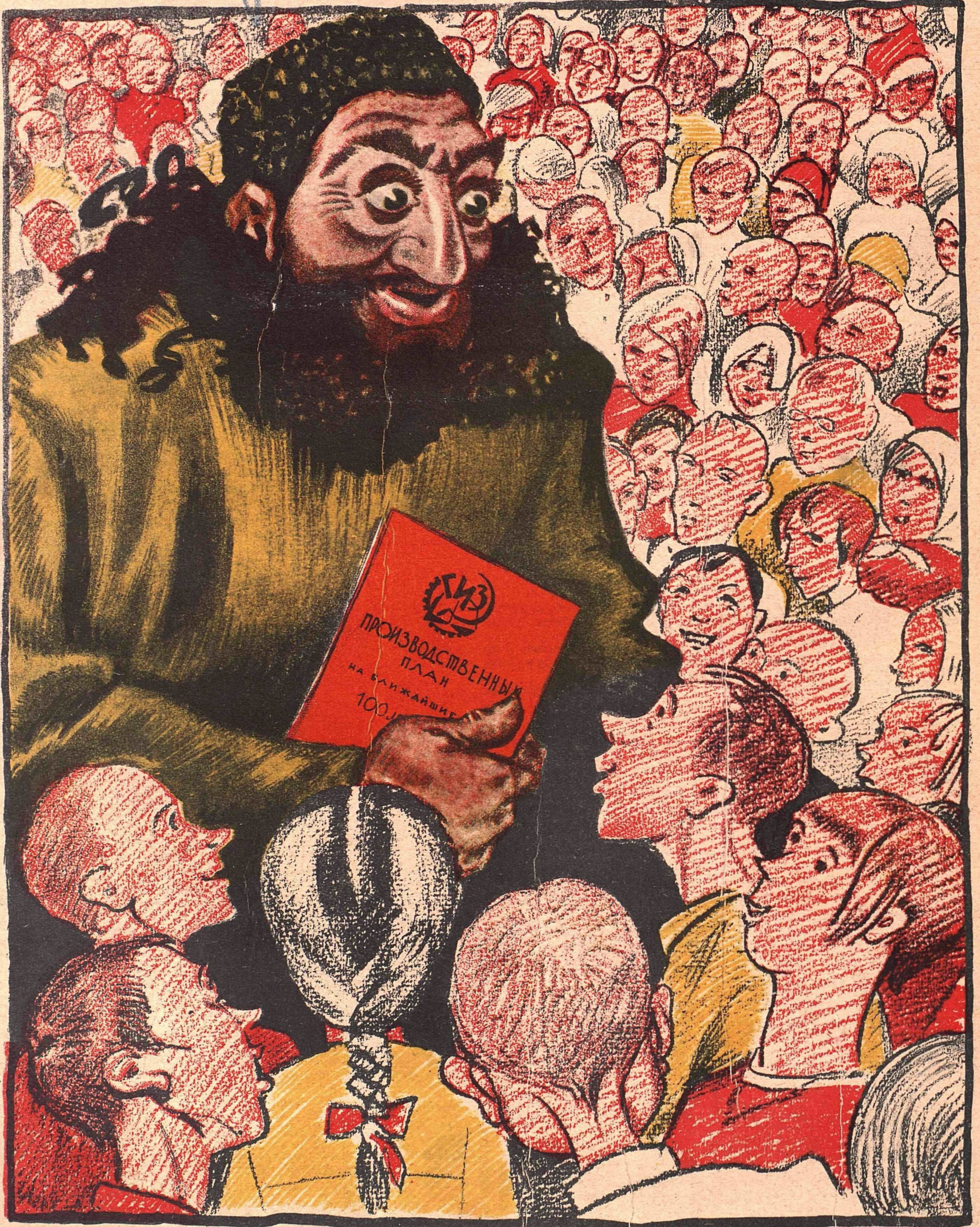
Рис. К. Елисева

ДЕТИ: — Брось, дедушка, сказки рассказывать, — лучше начни их издавать!..