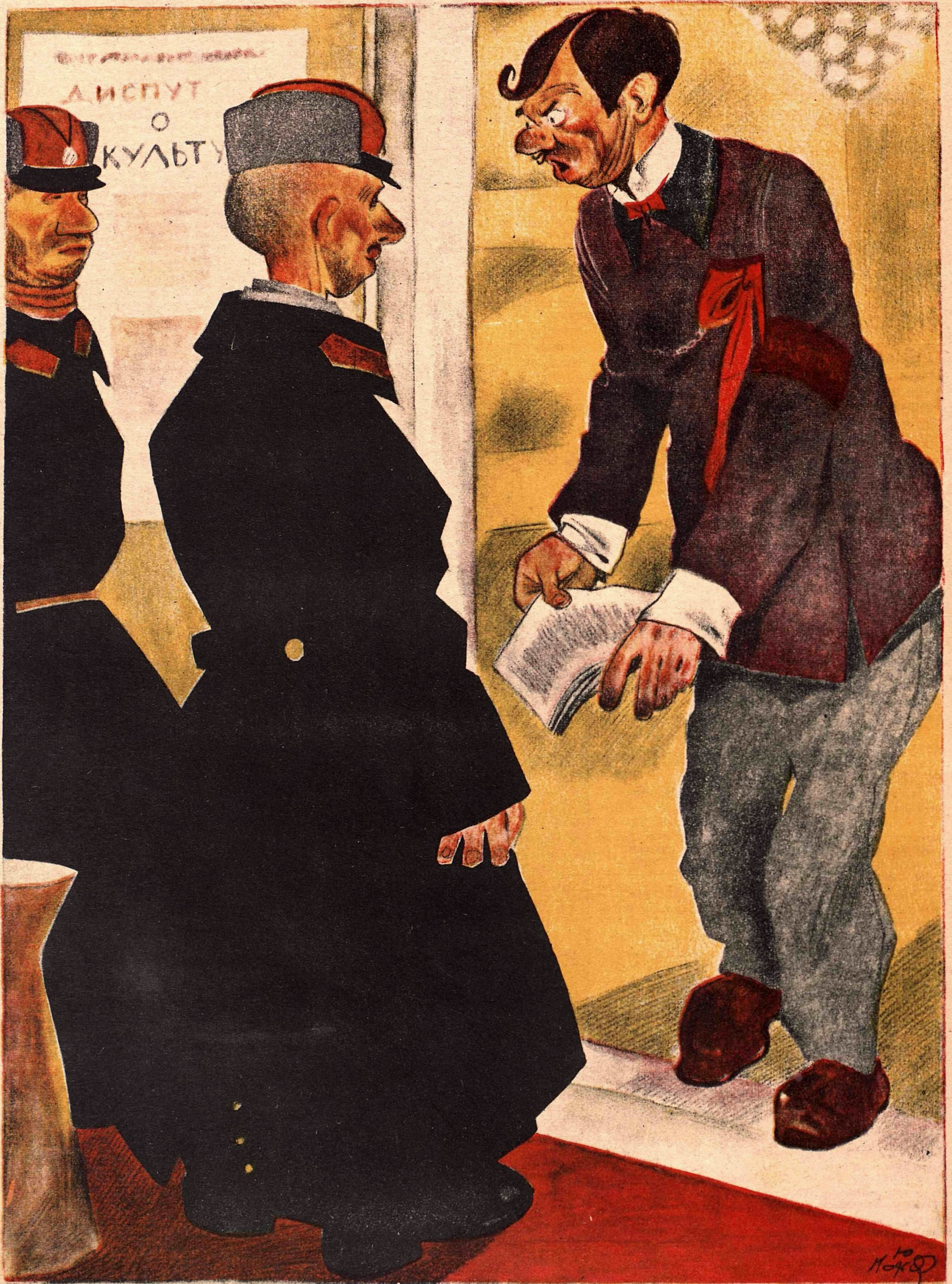
Рис. Ю. Ганфа

РАСПОРЯДИТЕЛЬ: — Что у вас районный — с ума сошел, что ли?! У нас диспут о культуре, а он вместо усиленного наряда всего-на-все двоих прислал!